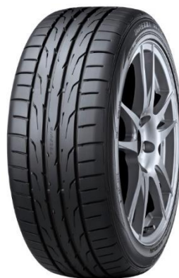
Direzza DZ102: desempenho esportivo