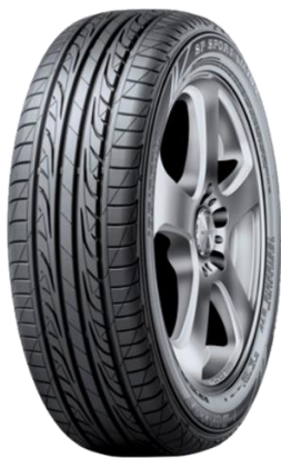
SP Sport LM704: mais conforto e durabilidade

Por exemplo, para o consumidor que busca, principalmente, conforto e durabilidade, o SP Sport LM704, é uma ótima opção. Já para aquele consumidor que prioriza um desempenho mais esportivo, a recomendação é o Direzza DZ102: